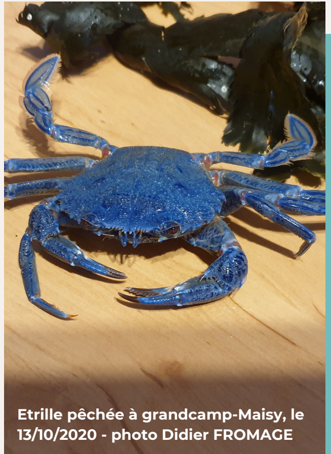
Etrille pêchée à grandcamp-Maisy, le 13/10/2020

“La particularité physique de ces spécimens, cette teinte bleue exceptionnelle, est due à une anomalie génétique qui favorise le développement en excès de crustacyanine .