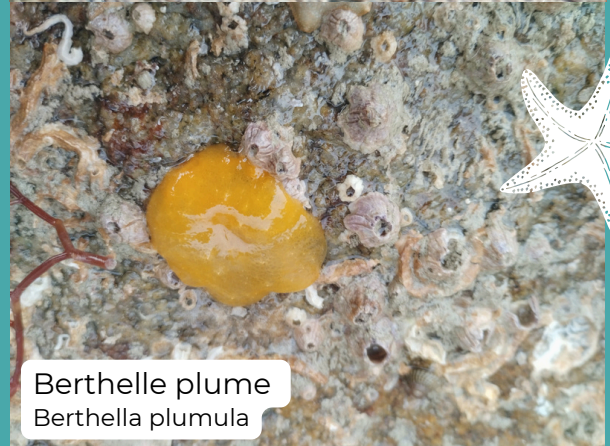
Berthelle plume Berthella plumula