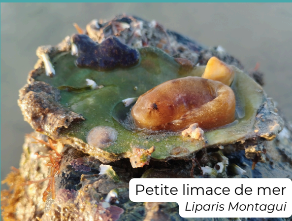
Petite limace de mer Liparis Montagu