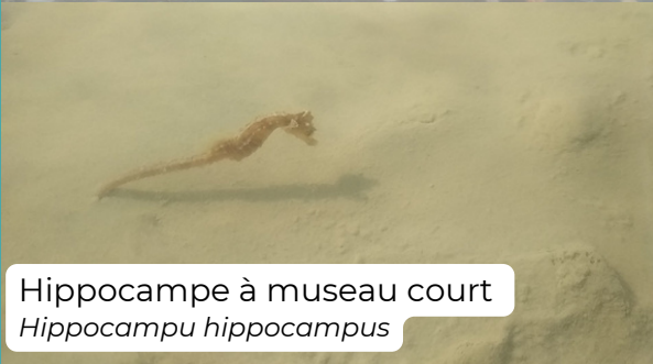
Hippocampe à museau court Hippocampus hippocampus