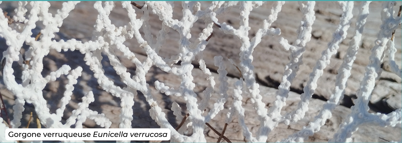
Gorgone verruqueuse Eunicella verrucosa