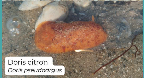
Doris citron Doris pseudoargus