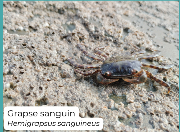
Grapse sanguin Hemigrapsus sanguineus