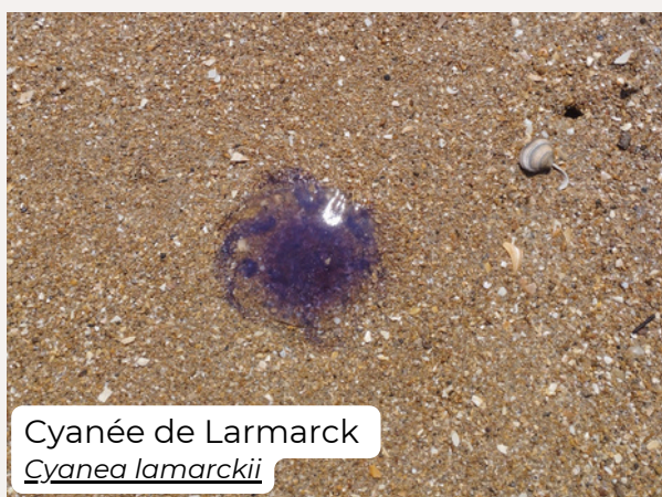
Cyanée de Lamarck Cyanea lamarckii