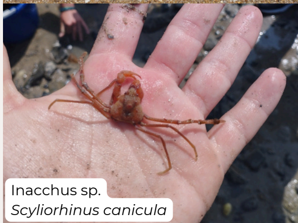
Inacchus sp. Scylliorhinus canicula