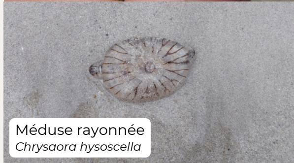
Méduse rayonnée Chrysaora hysoscella