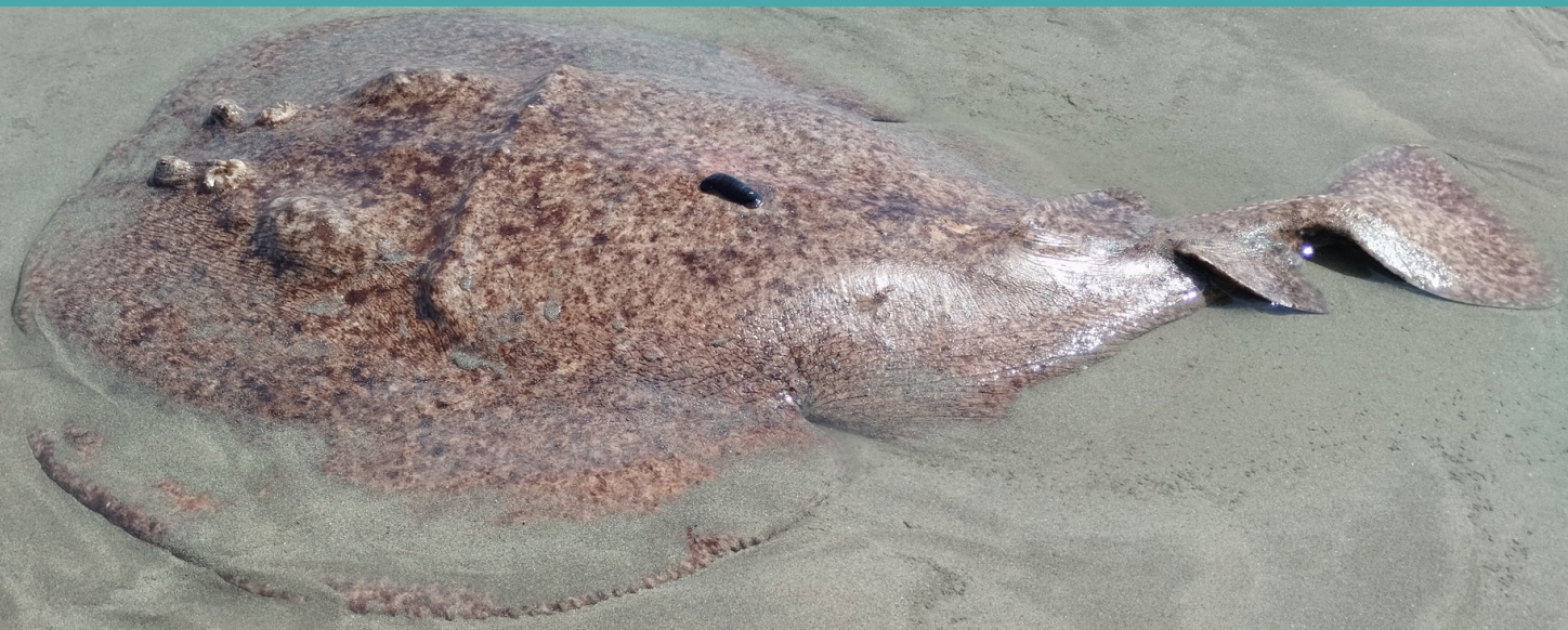
Torpille marbrée Torpedo marmorata