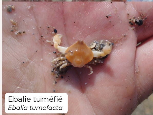
Ebalie tuméfié Ebalia tumefacta