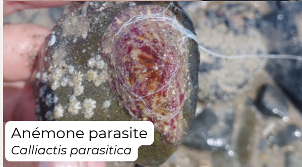
Anémone parasite Calliactis parasitica