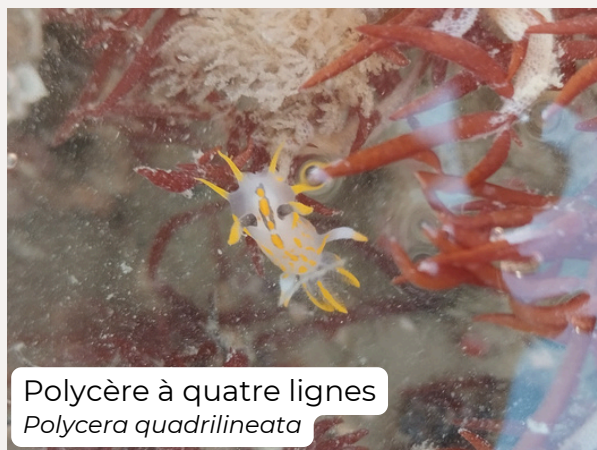
Polycère à quatre lignes Polycera quadrilineata